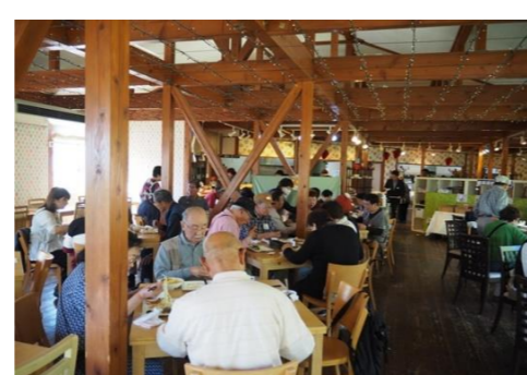
思い思いに食べ放題のランチタイム