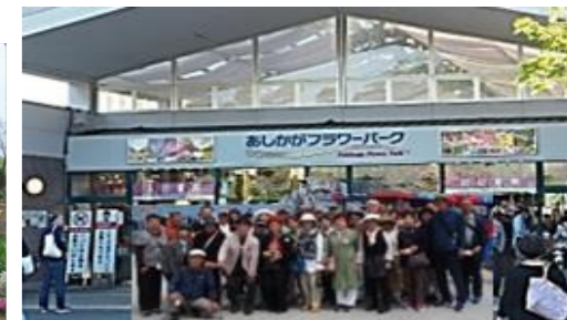
※この写真は合成したものです