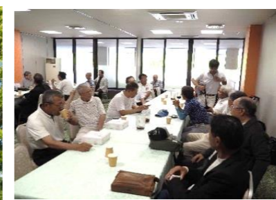
競技が終わりゆっくりと！