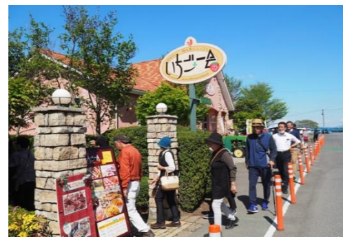
レストラン“いちご会”に向かう！