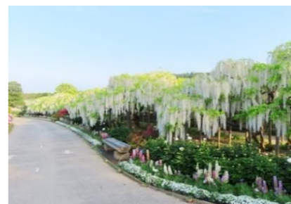
白藤も印象的でした！