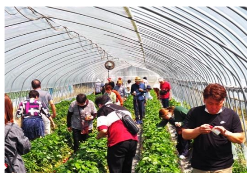
ハウスの中はいちごがいっぱい

栃木いちごの里では、いちご狩り(スカイベリー)30分食べ放題、昼食前でもいちごは水分なので、お腹いっぱい食べてもランチビュッフェは大丈夫と添乗員さんに聞いていたので、皆さんそれぞれ大粒のスカイベリーを思う存分味わいました。