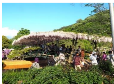
うす紅橋に架かる藤の花！