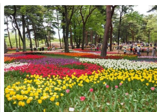
チューリップも色鮮やかに！