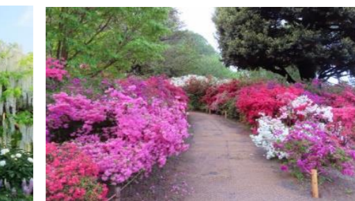
つつじも負けじと咲いてます