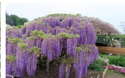
満開のむらさき藤