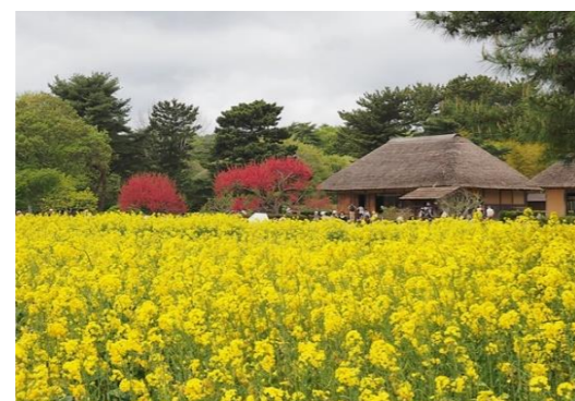
菜の花も丘の裾に綺麗に！