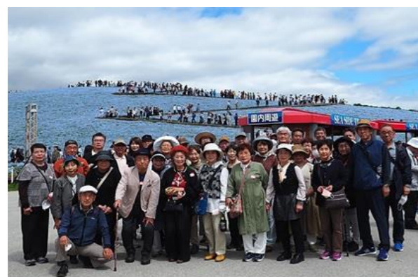
青く染まったみはらしの丘を背景に全員集合