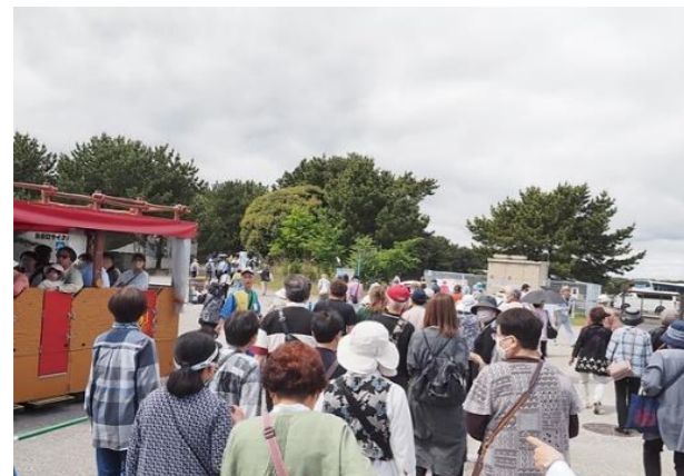
海浜口・風のゲートから入場

“みはらしの丘”一面がネモフィラで青く染まり、裾には黄色の菜の花が負けじと咲き、少し離れた“たまごの森フラワーガーデン”には、さまざまな色のチューリップが鮮やかに咲いて目を楽しませてくれました。ネモフィラに菜の花や色鮮やかなチューリップに元気なエネルギーを貰いました。