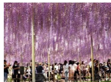
大藤棚を鑑賞する！

樹齢160年超の世界に誇る2本の大藤棚や、白藤トンネル・うす紅橋・むらさき藤のスクリーン等350本以上の見応えのある藤が咲いていました。また、つつじやいろいろな草花が沢山咲いていて集合時間迄ゆっくりと園内を散策して楽しみました。