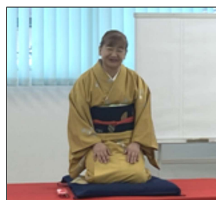
みきていーさん 杜の家くるみさん